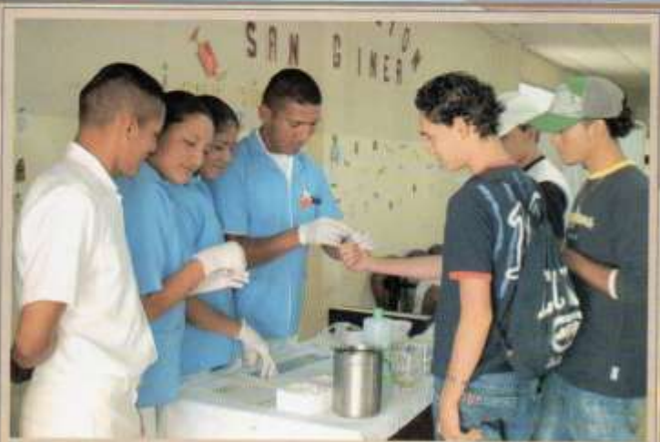
Examen de Sangre a alumnos de los colegios de la Península de Santa Elena