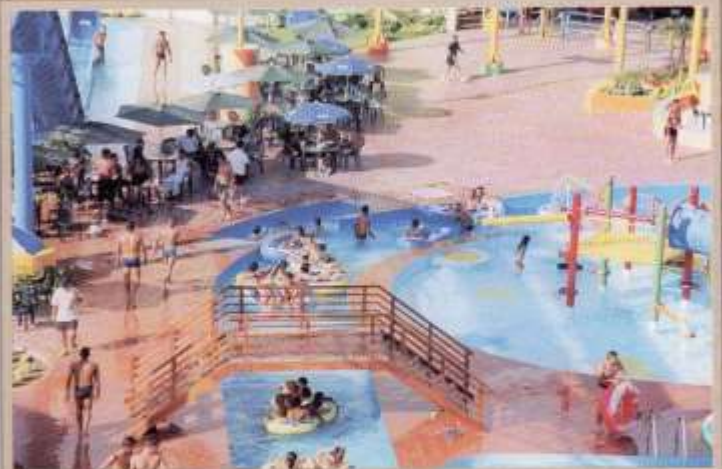
Festividades ESGRUM en Complejo Acuático de Salinas.