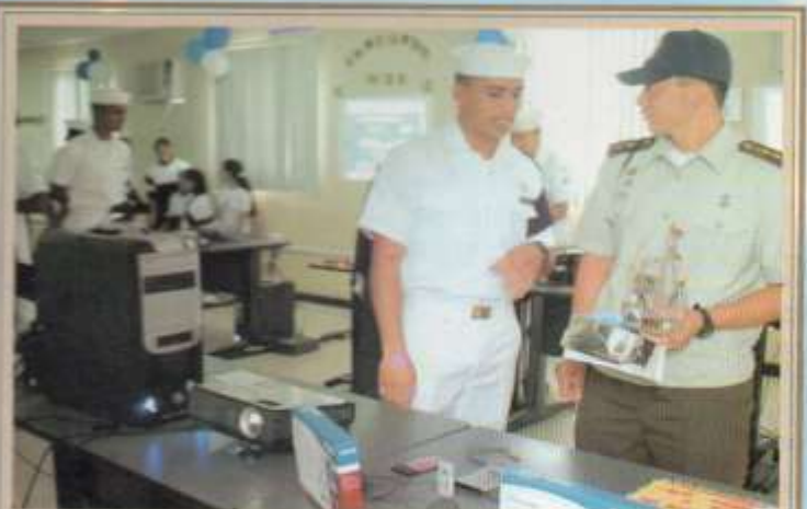
Visita de Oficiales del Ejército de la República de China a los Stand de la Casa Abierta