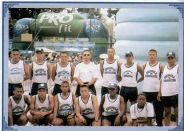
Selección de atletismo de la Escuela de Grumetes "Contramaestre Juan Suárez".