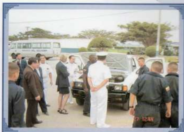
Los Grumetes choferes demuestran sus conocimientos en mantenimiento y reparación de vehículos.