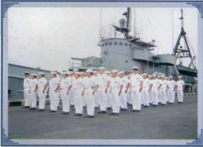
Brigada de Grumetes e instructores prestos a embarcarse a bordo del Remolcador Chimborazo.