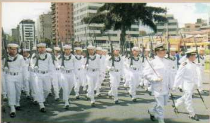
Participación en el Desfile Militar del 24 de Mayo.