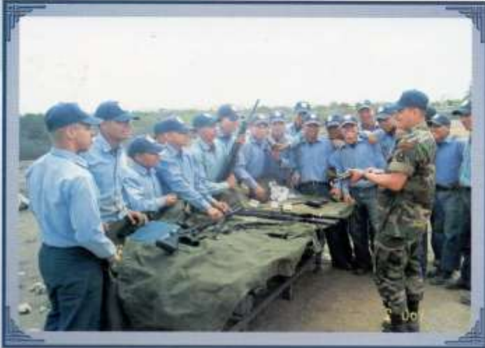
Instrucción de montaje y desmontaje de armamento menor.