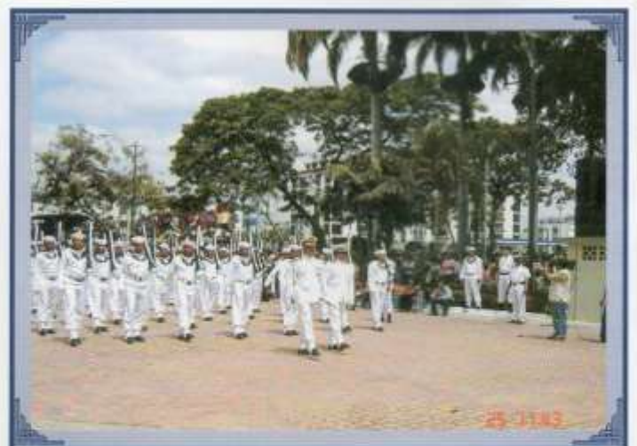
Participación en el desfile militar del 25 de julio.