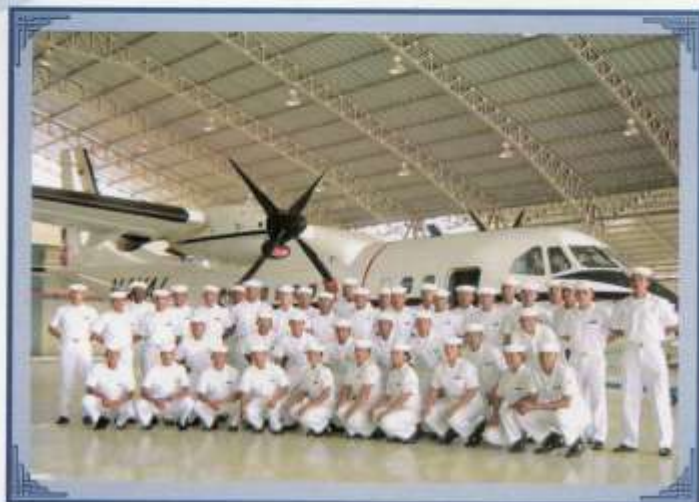
Visita profesional de Grumetes a Estación Aeronaval de Manta.