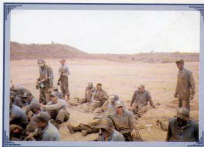
La práctica en terreno es el complemento de la formación militar del Grumete.