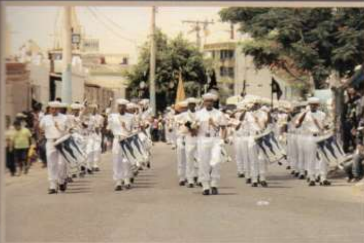
Participación en el Desfile Cívico militar del Cantón La Libertad.