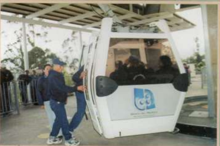
Actividades recreativas en el Teleférico de la Ciudad de Quito.