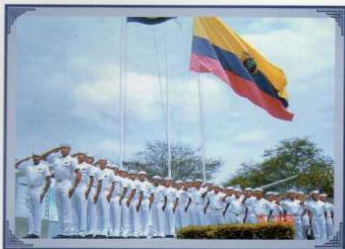
Porte militar demostrado por nuestro grumetes en actos cívicos.