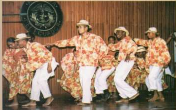
Presentación del Grupo de Marimba de la Escuela de Grumetes.