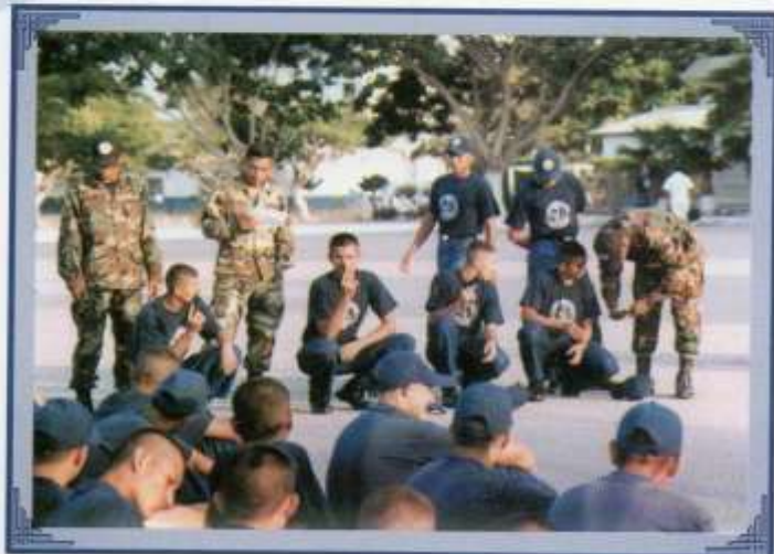
Instrucción previa a práctica en el terreno.