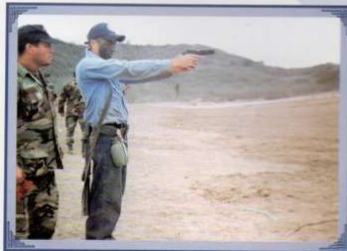
Práctica con pistola en el polígono de tiro.