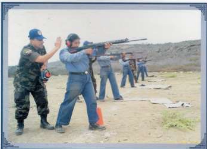
Práctica con fusil en el polígono de tiro.