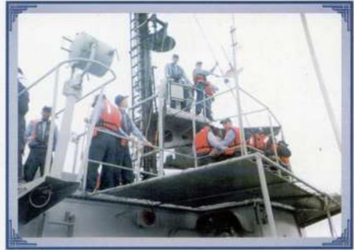
Instrucción a bordo del Remolcador Chimborazo.