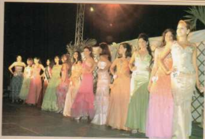
Presentación de Candidatas a Reina ESRUM 2006