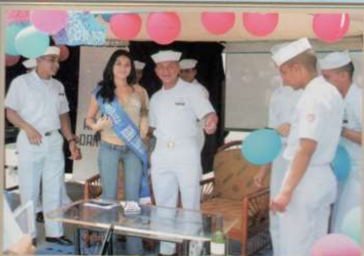
Visita de candidatas a Reina, a los Stand de la Casa Abierta 2006