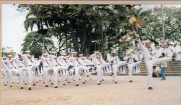
Participación de la Brigada de Grumetes en el Desfile del 25 de Julio en el Parque de la Armada.