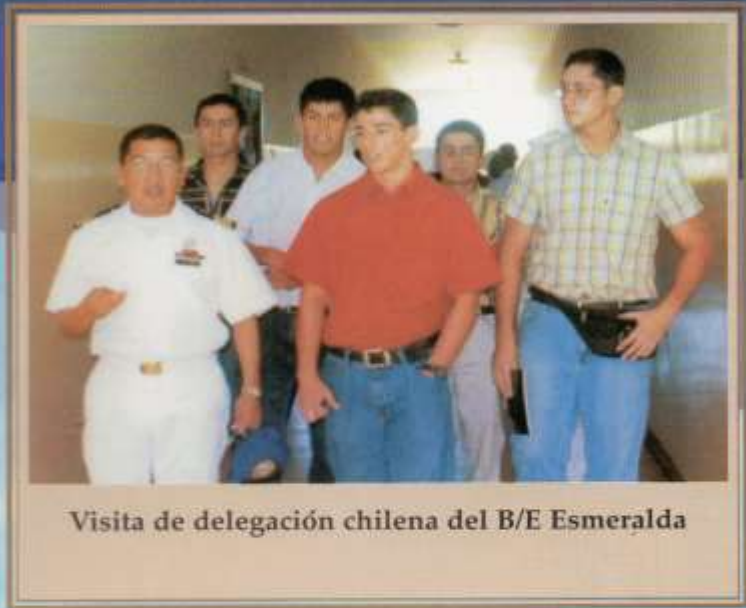
Visita de delegación chilena del B/E Esmeralda