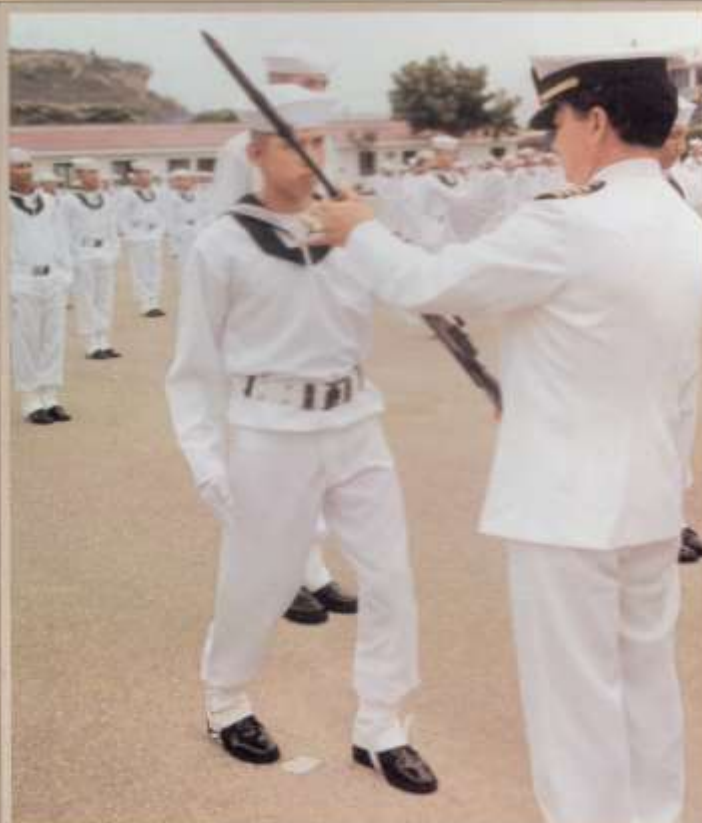
Entrega de Armas a la LXXXV Promoción de Grumetes.