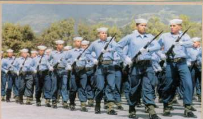
Repaso para el desfile del 24 de Mayo en la Escuela Superior Militar en Parcayacu.