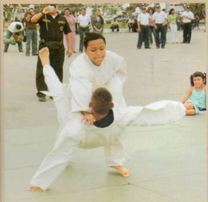
Demostración de Judo