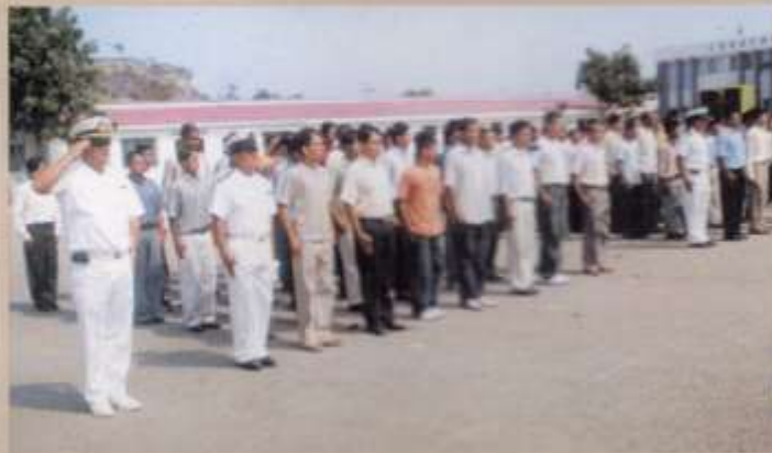
Ingreso a la Escuela de Grumetes