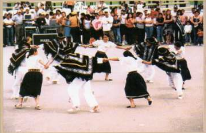
Presentación del Grupo Folklórico de la Escuela de Grumetes.