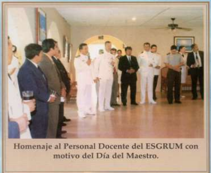
Homenaje al Personal Docente del ESRUM con motivo del Día del Maestro.