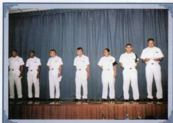
Reconocimiento a participantes del concurso de oratoria realizado durante la semana del Grumete.