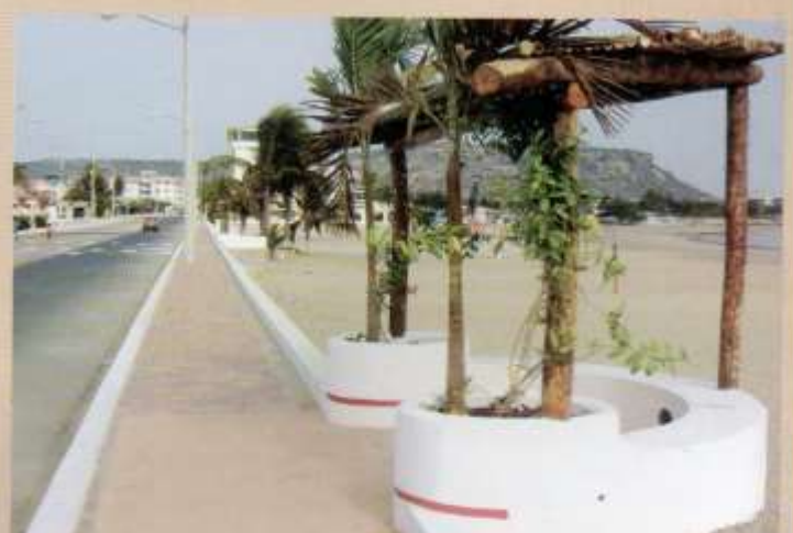
Construcción e inauguración del nuevo Gate de acceso principal a la Base Naval de Salinas y Regeneración su Malecón.