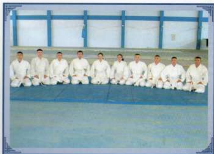
Selección de judo.