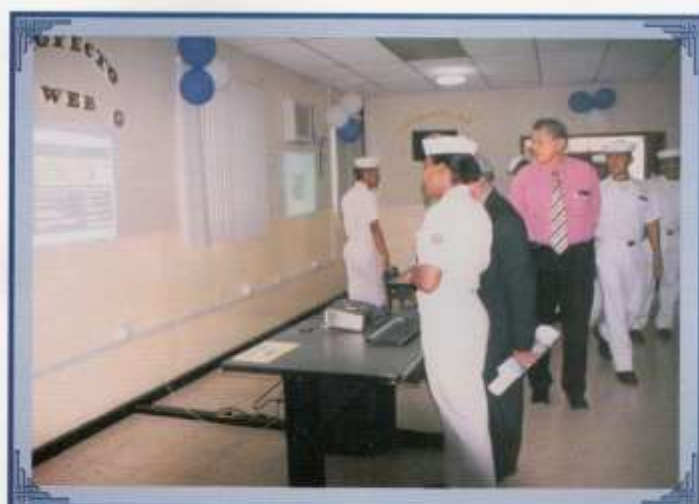
Contribución de Grumetes en la elaboración de la página web del reparto.