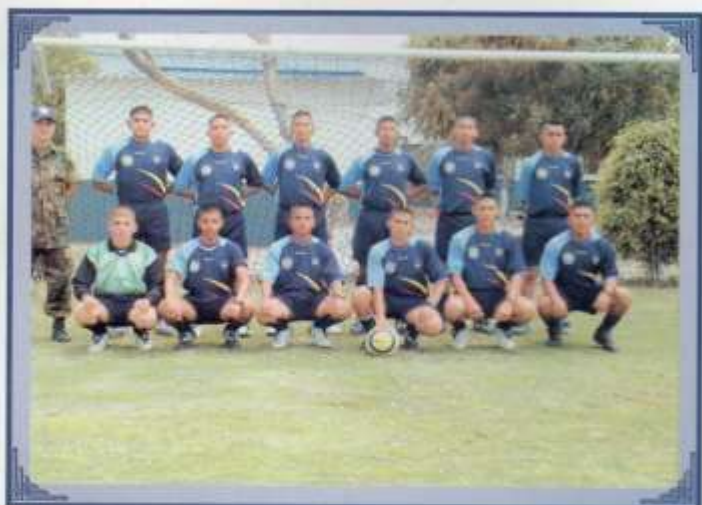
Selección de fútbol.