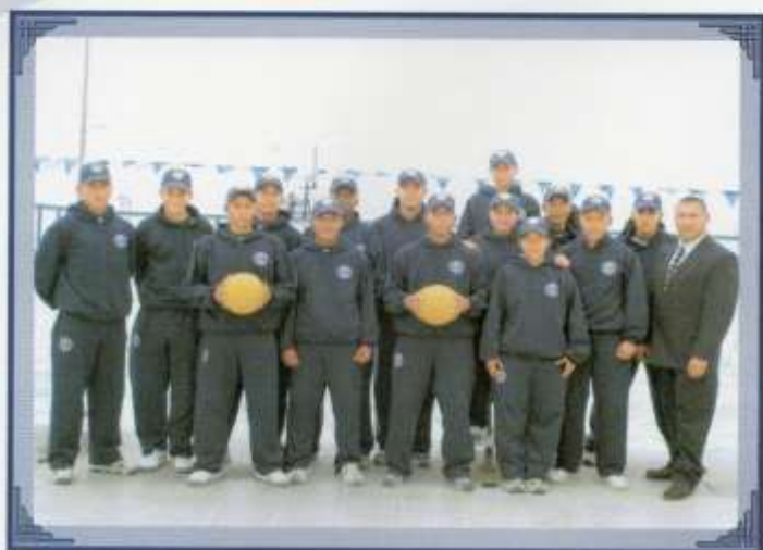
Selección de waterpolo.