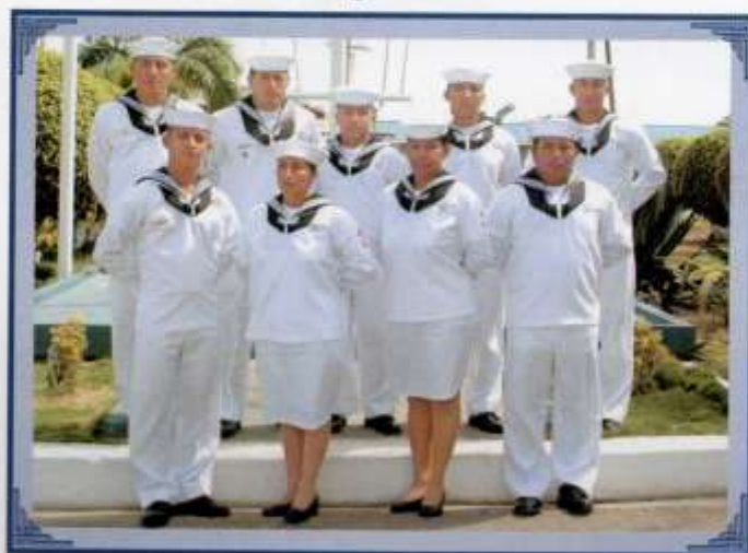
Cabos y Marineros