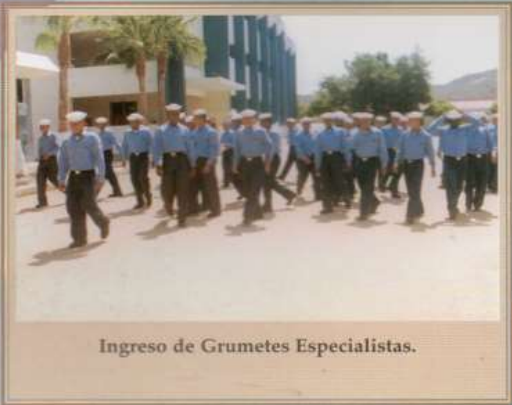
Ingreso de Grumetes Especialistas.