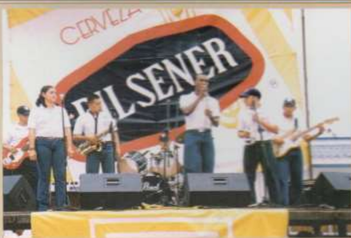
Presentación del Grupo Neptuno.