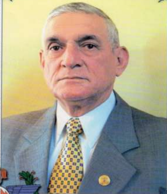
Grad. (SP) Marcelo Delgado Alvear MINISTRO DE DEFENSA NACIONAL