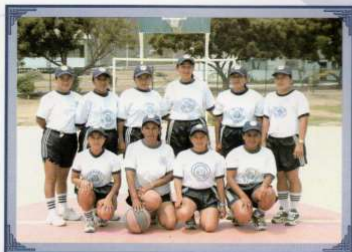
Selección femenina de básquet.