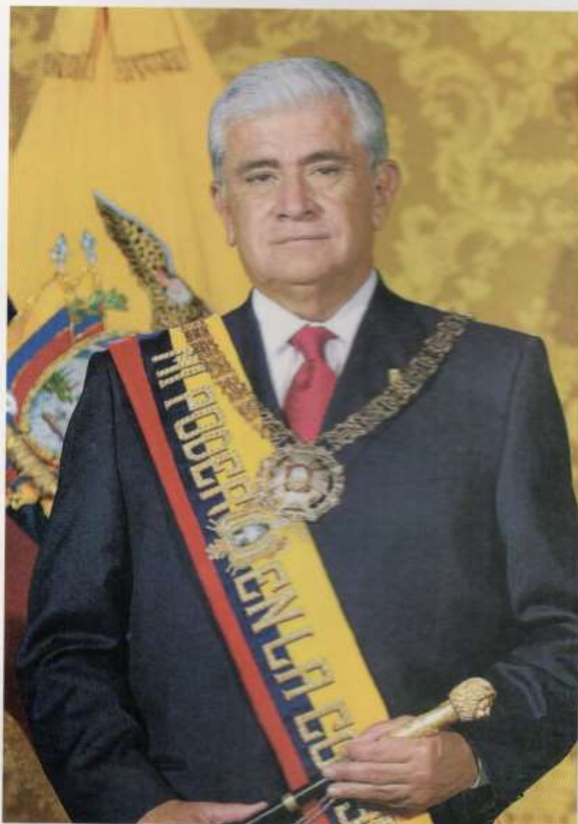
Dr. Alfredo Palacio González

PRESIDENTE CONSTITUCIONAL DE LA REPÚBLICA DEL ECUADOR