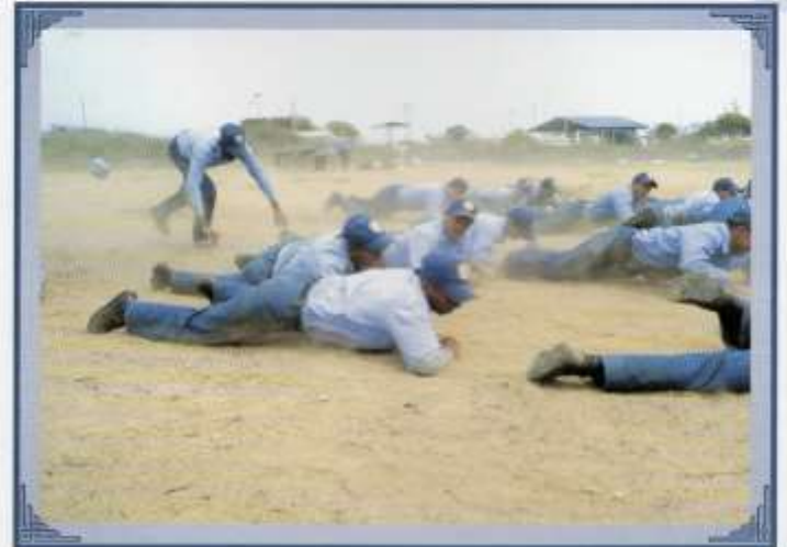
Prácticas en el terreno.