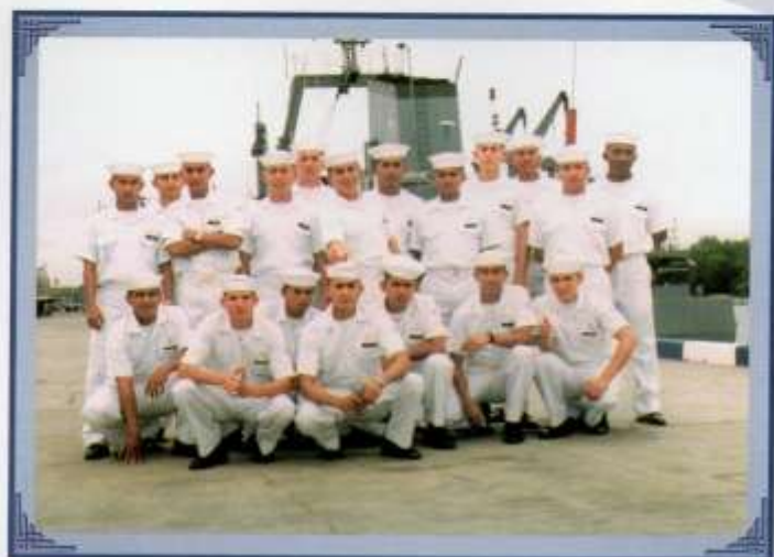
Visita profesional de Grumetes a las Unidades de la Escuadra.