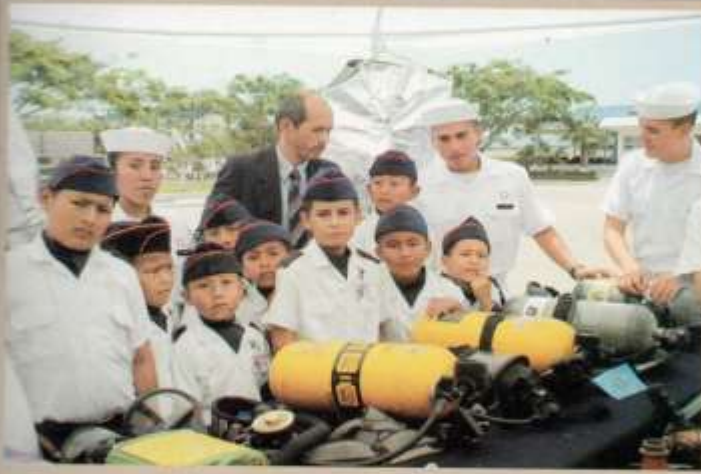
Demostración de equipos de respiración artificial