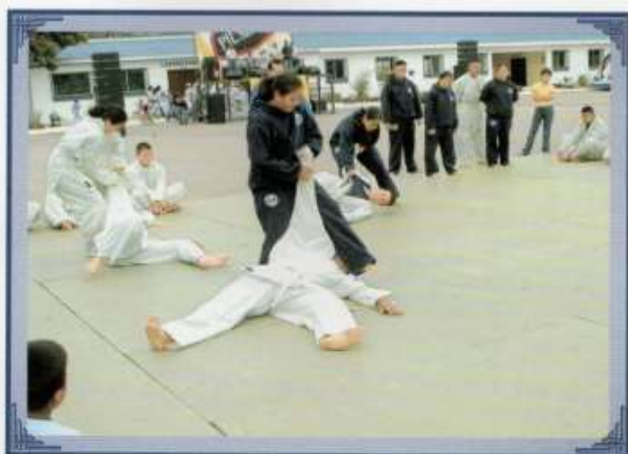
Demostraciones de judo.