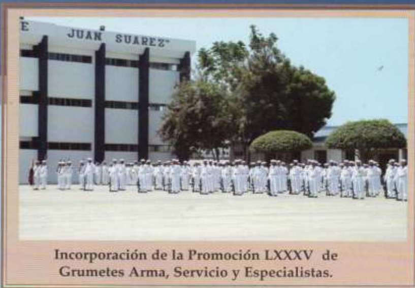
Incorporación de la Promoción LXXXV de Grumetes Arma, Servicio y Especialistas.