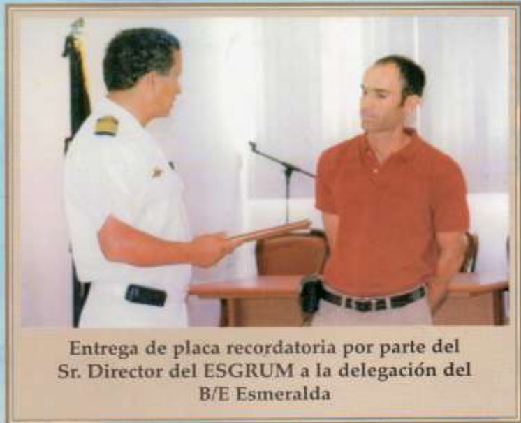
Entrega de placa recordatoria por parte del Sr. Director del ESRUM a la delegación del B/E Esmeralda