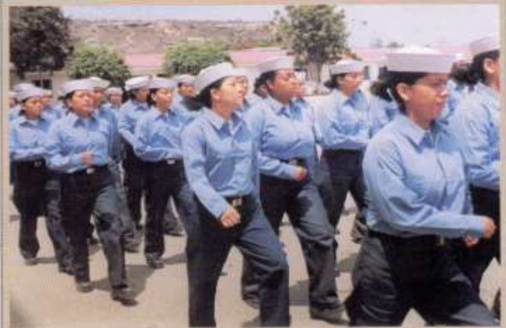
Presencia Femenina al ingreso al ESGRUM 2006.