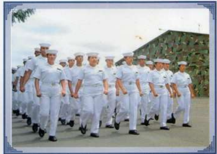
Visita de los Grumetes a la Base Naval de Jaramijó en Manta