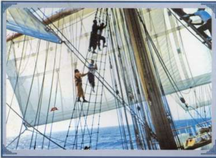
Maniobra de Vela a bordo del Buque Escuela Guayas.