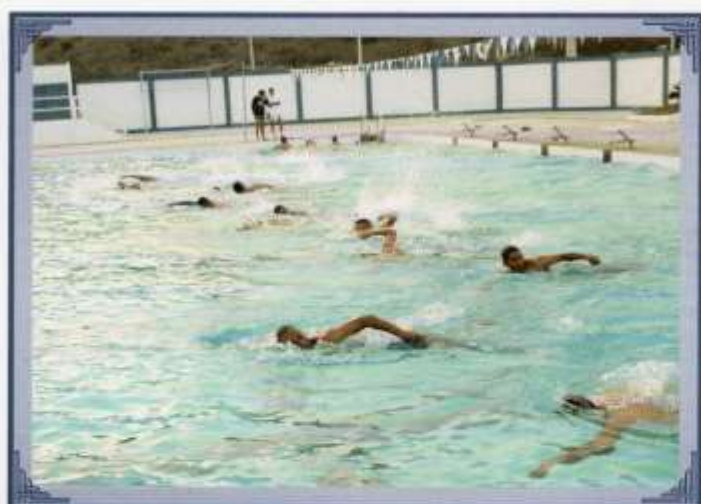
Selección de natación.