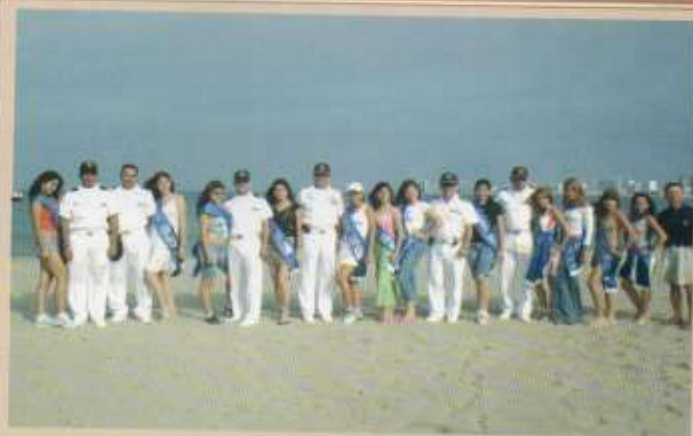
Srtas. Candidatas a Reina Esgrum 2006 comparten una tarde de camaradería entre personal de ESGRUM y ESSUNA.