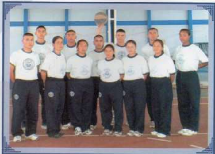
Selección de gimnasia olímpica.