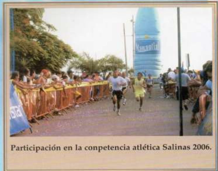
Participación en la competencia atlética Salinas 2006.