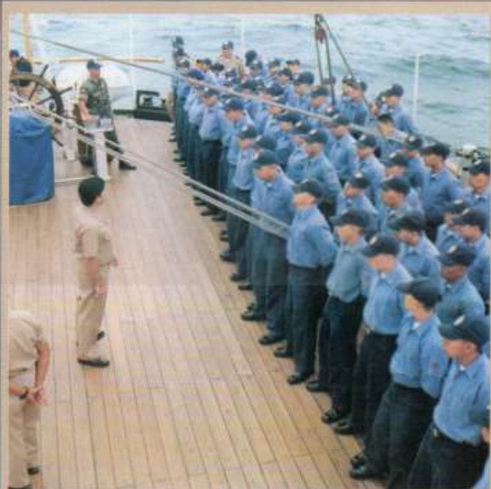
Período de embarque de Grumetes promoción LXXXV abordo de Buque Escuela Guayas.