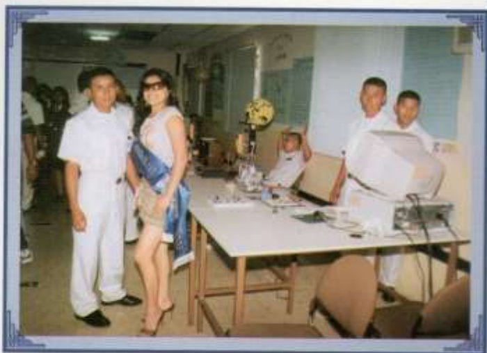
Visita de candidatas a reina en stands de la Casa Abierta ESRUM 2006.