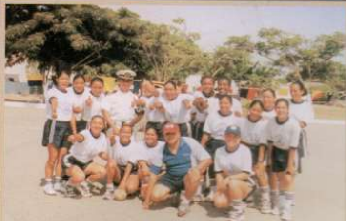
Competencias deportivas entre los instructores y grumetes.