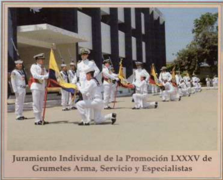
Juramiento Individual de la Promoción LXXXV de Grumetes Arma, Servicio y Especialistas